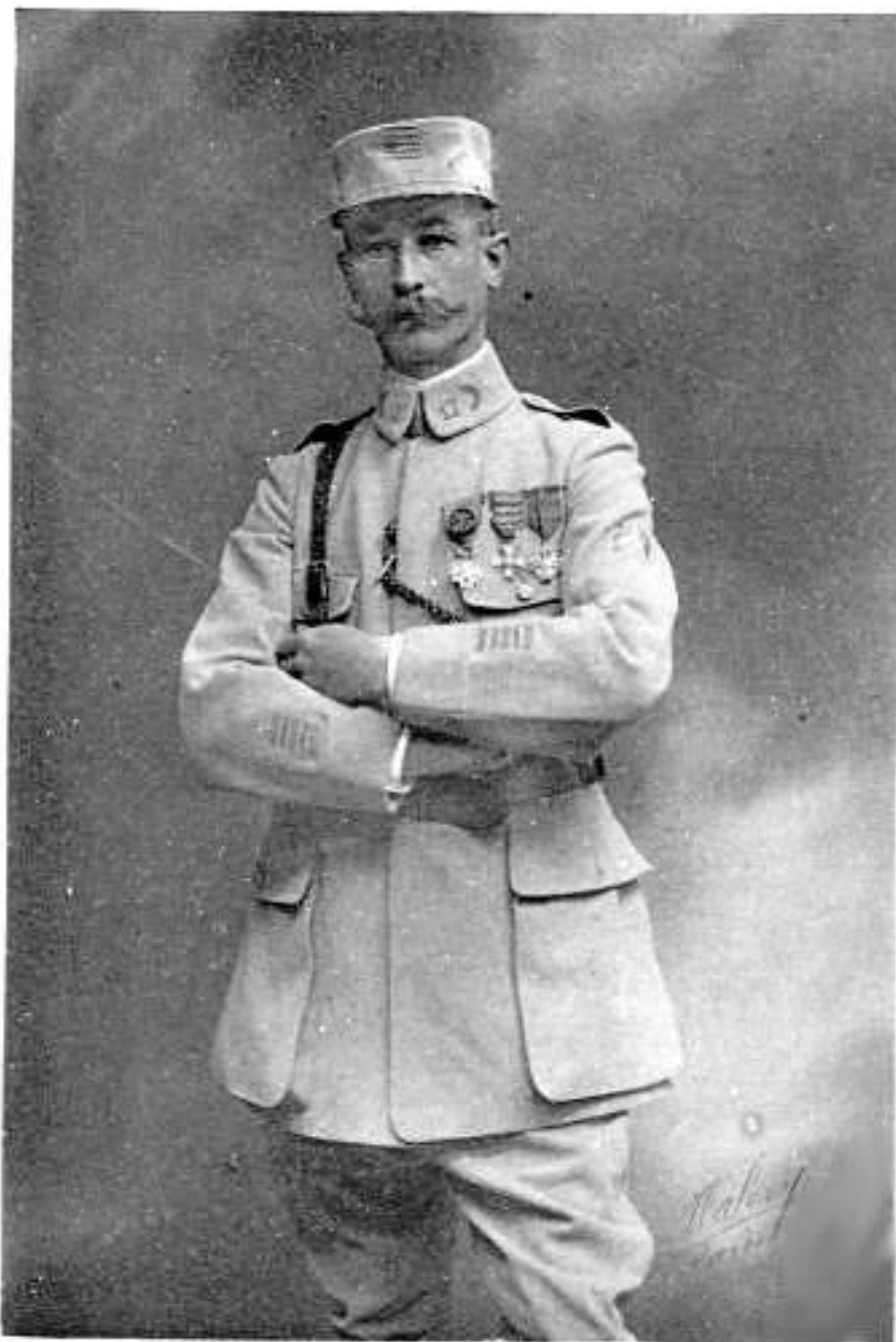
Colonel MARESCHAL - Septembre 1914 - Mai 1916