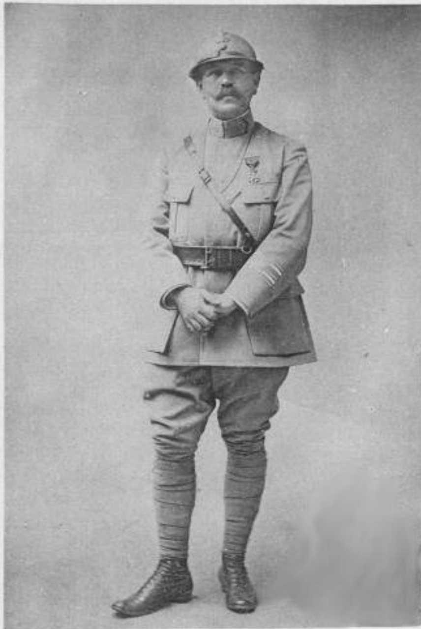
Colonel PAITARD, Commandeur de la Légion d'Honneur Tombé au Champ d'Honneur le 1er Juin 1918 à Pernant