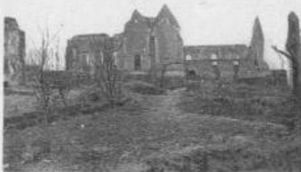
Eglise de FOUCAUCOURT (Novembre 1916) - (Somme)