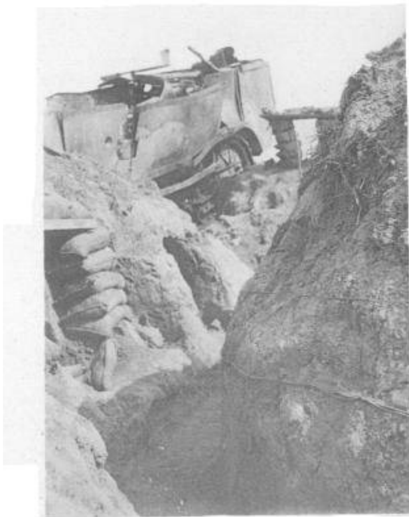
Tank détruit - Avril 1917 - Tranchée de la PERTUISANE (Aisne)