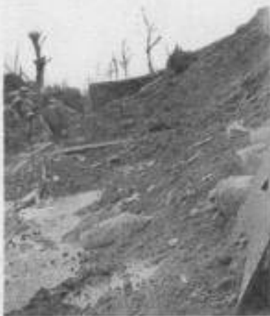
Chemin creux près de la Sucrierie de GENERMONT (Octobre 1916) - Somme